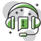
Servizi per le imprese associate