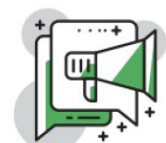
Comunicazione e attività editoriale