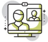
Formazione e cultura d'impresa